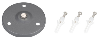
Рис. 2. Основание для установки на поверхность (ALT-BASE-R75, арт. 024890)