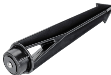
Рис. 3. Основание для установки в грунт (ALT-SPIKE-175, арт. 024888)