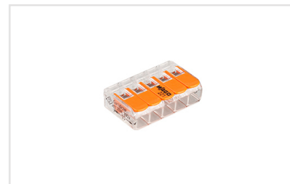
Артикул 025721 Универсальная компактная клемма серии 221 для 5-ти медных проводников. Прозрачный корпус. Тип разъема - рычажок.