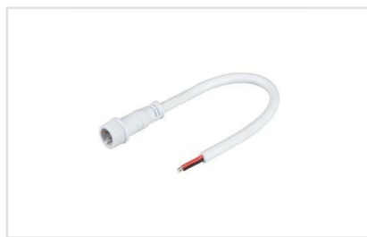
Артикул 032852 Круглый герметичный разъем серии ARL, 2 pin ПАПА с резьбовым креплением для подключения питания герметичных одноцветных светодиодных лент. Корпус IP65. Провод 20AWG (0).