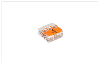
Артикул 025720 Универсальная компактная клемма серии 221 для 3-х медных проводников. Прозрачный корпус. Тип разъема - рычажок.