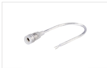
Артикул 022354 Круглый герметичный разъем DC 2-pin MAMA для соединения отрезков одноцветных светодиодных лент. Корпус IP65. Провод 20AWG 15 см. Максимальный допустимый ток 3А.