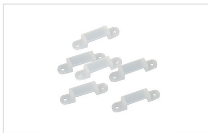
Артикул 017723(2) Силиконовый держатель для монтажа герметичных лент (PFS, PS, PGS) шириной до 13мм.