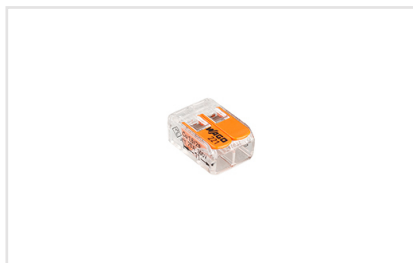
Артикул 025719 Универсальная компактная клемма серии 221 для 2-х медных проводников. Прозрачный корпус. Тип разъема - рычажок.