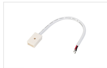
Артикул 025174 Коннектор для подключения одноцветных герметичных светодиодных лент с шириной платы 10мм серии RTW 2-5000PS-50m и RTW 2-5000PS.