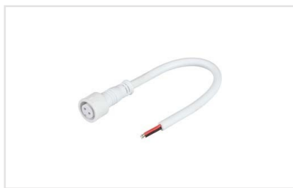
Артикул 032851 Круглый герметичный разъем серии ARL, 2pin MAMA с резьбовым креплением для подключения питания герметичных одноцветных светодиодных лент. Корпус IP65. Провод 20AWG (0).